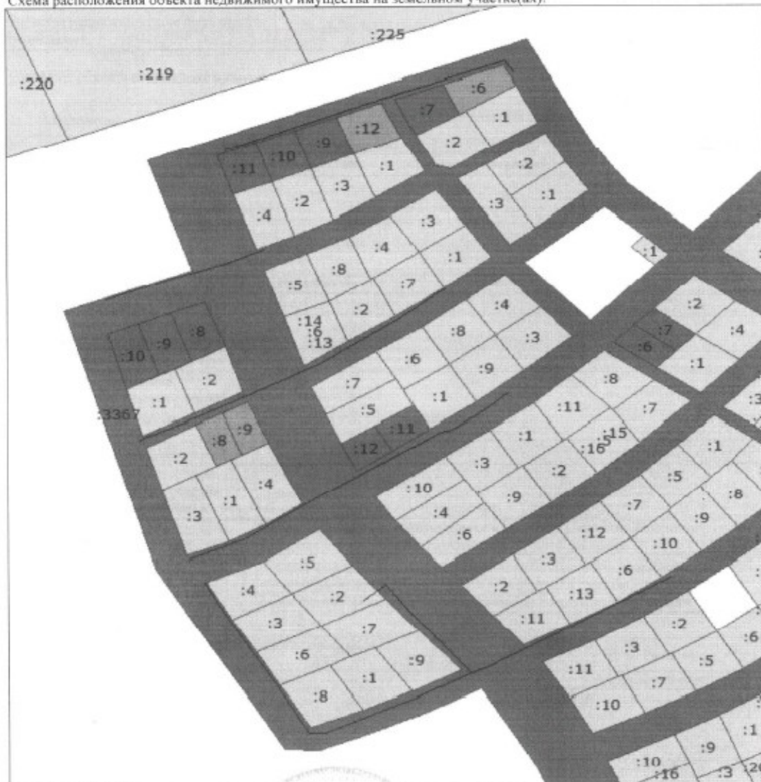
Схема расположения объекта недвижимого имущества на земельном участке(ах):